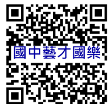
桃園市國民中學藝術才能國樂班 鑑定線上報名系統